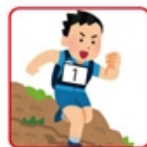
ウェアの胸部/腹部 取り付ける