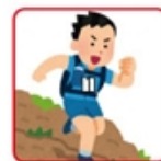
小さく折りたたむ