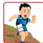
パンツに取り付ける